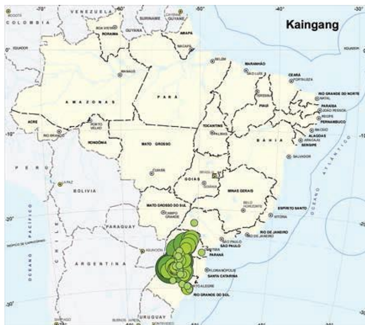
Adaptado do encarte: Brasil Indígena . Brasília: FUNAI, IBGE, [2012]